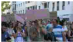
Tutte le news > ▶ A Majorca 20.000 manifestanti contro l'overtourism