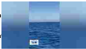
▶ Oltre 200 delfini avvistati al largo di Ischia in direzione Ventotene