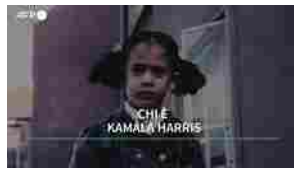
▶ Chi è Kamala Harris