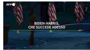
▶ Biden-Harris, che succede adesso